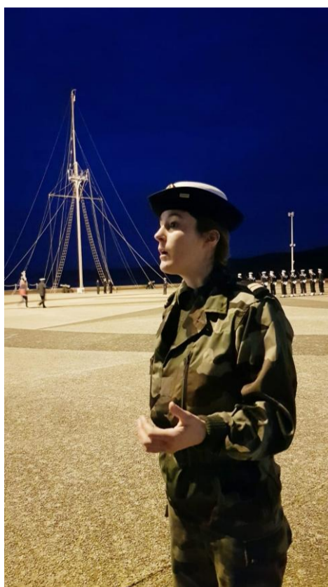
EV1 à l'Ecole navale de Lanvéoc.

Un grand merci à la Marine nationale pour son aide à la réalisation de ce journal.