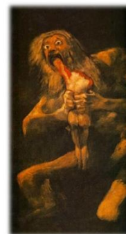
Francisco Goya, Saturne dévorant son fils